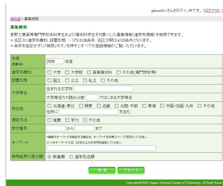
募集要項検索ページ