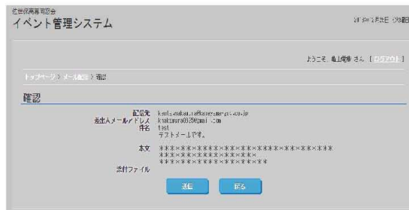
メールテンプレート機能