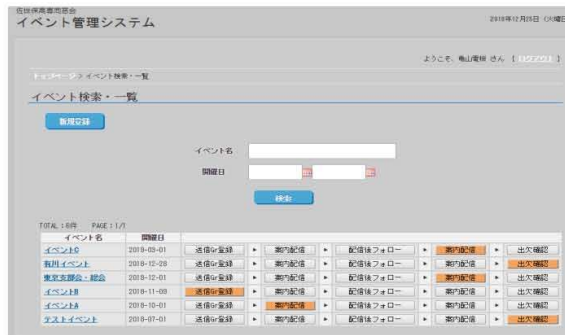
イベント管理画面